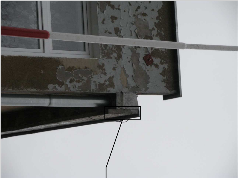
element do skucia